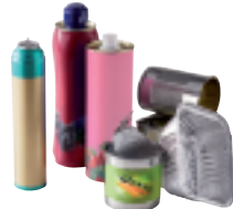
Boîtes en métal et aérosols