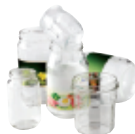
Pots et bocaux