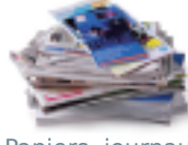
Papiers, journaux, magazines, prospectus, annuaires, enveloppes