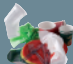
Vaisselle jetable et serviettes en papier