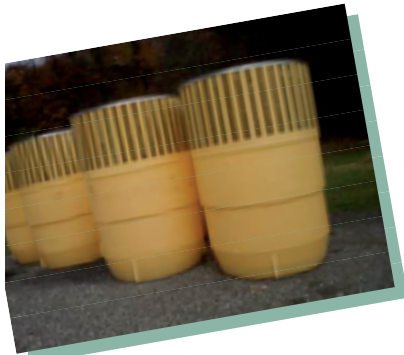
Les conteneurs semi-enterrés ont une capacité de stockage plus importante