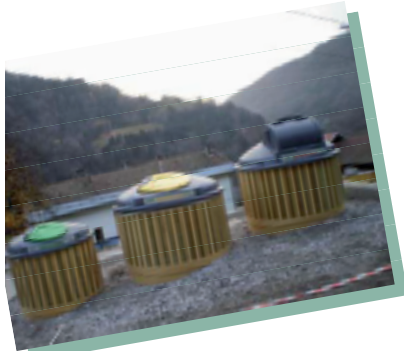
Plus pratique et esthétique, les « Points Tri » améliorent le service aux habitants